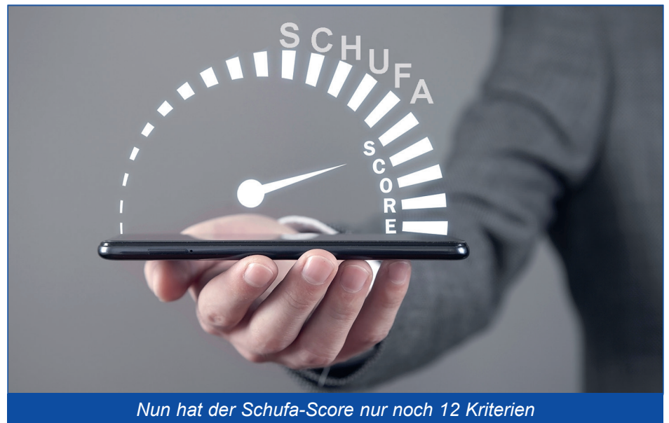
Nun hat der Schufa-Score nur noch 12 Kriterien

Die digitale Registrierung erfolgt auf app.Schufa.de mit E-Mail-Adresse und Passwort plus einer Identitätsprüfung mit einem Ident-Verfahren oder der Online-Ausweisfunktion. Da